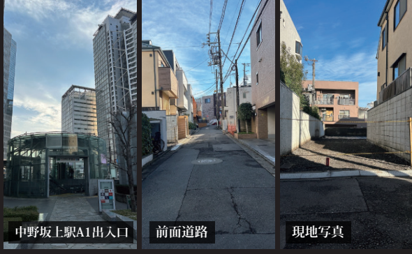
中野坂上駅A1出入口